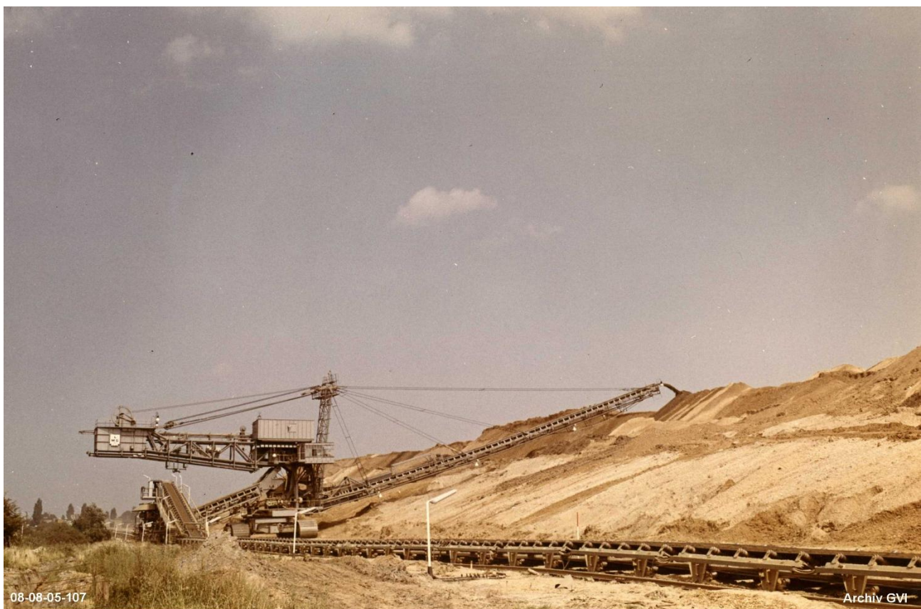
Absetzerbetrieb an Goltsteinkippe