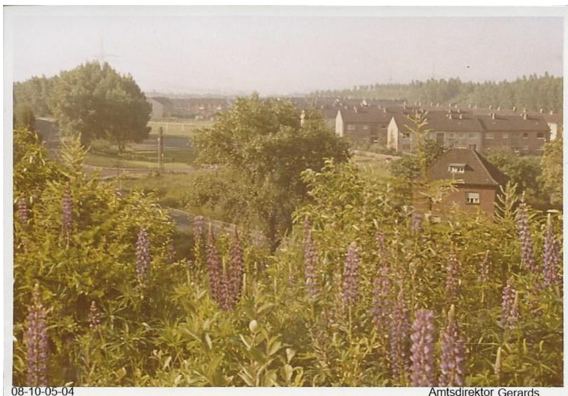
Blick von der rekultivierten Goltsteinhalde auf die neu erbaute Siedlung

12. Mai 1965 wird die letzte forstwirtschaftliche Rekultivierung aufgemessen. Anschließend erfolgt die Entlassung aus der Bergaufsicht.