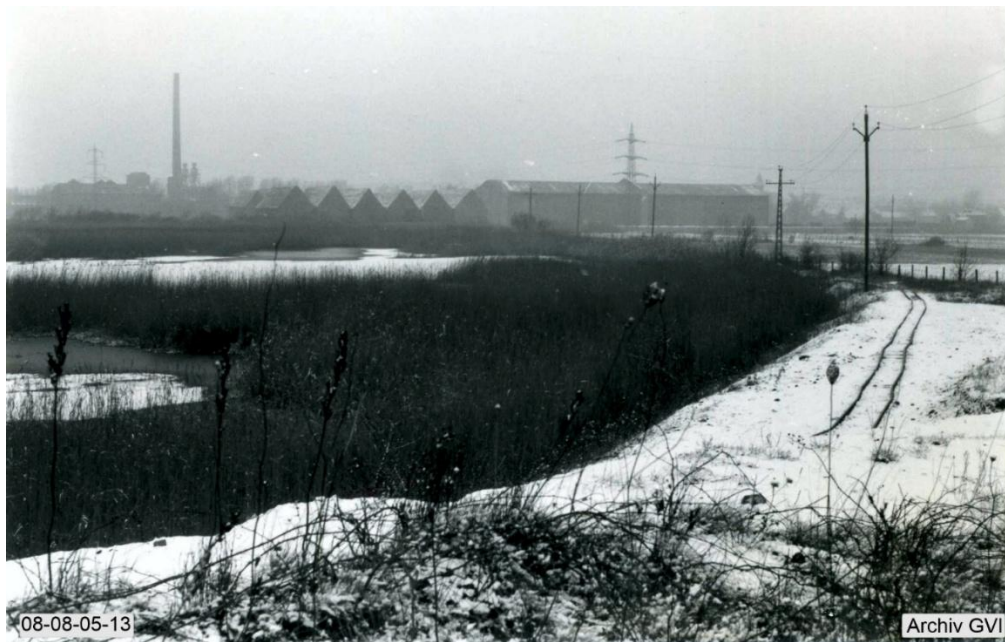
Foto aus den 1950er Jahren. Im Hintergrund, jenseits der Bahnlinie Stolberg-Jülich, stehen die Strohmieten der Papierfabrik Inden

Der 1902 zwischen dem Lucherberger Berg und Gut Merödgen aufgeschlossene Tagebau I füllte sich 1911 bei einem Wasserdurchbruch aus Quellen unterhalb der Lucherberger Obstwiese. Der Tagebaubetrieb musste aufgegeben werden. Bis zum Ende der Brikettproduktion im Jahre 1960 diente der See als Spülkippe für die Asche aus der Brikettfabrik Lucherberg. Aus dem ehemaligen Tagebau war der Schlammsee geworden.