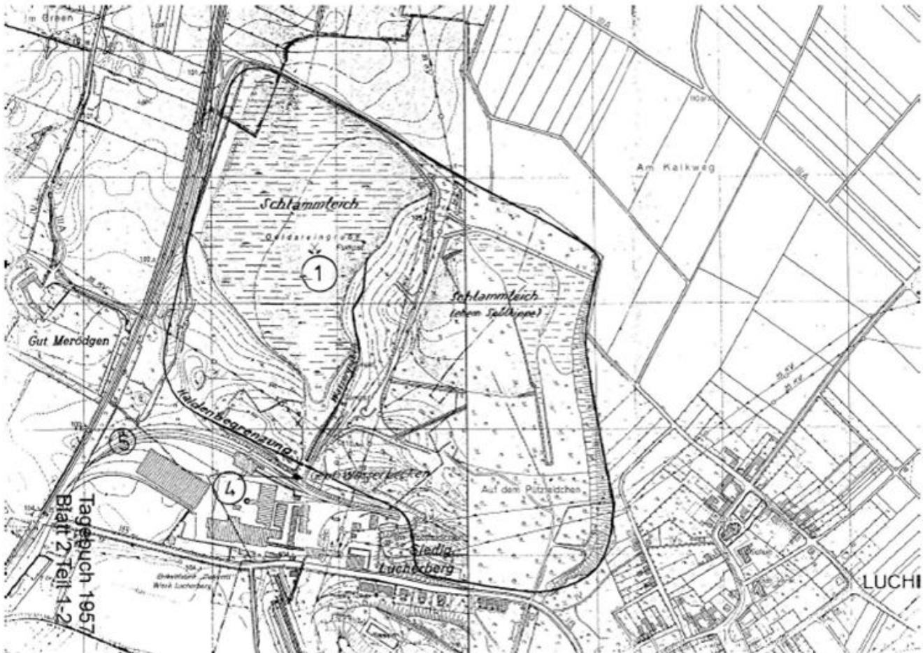
Karte 1957 Blatt 2-1 1

[...] In den ausgekohlten Tagebau wurden nur unwesentliche Mengen Abraum eingebracht. In der Hauptsache diente er als Deponie für die anfallende Asche der unmittelbar südwestlich gelegenen Brikettfabrik Lucherberg.