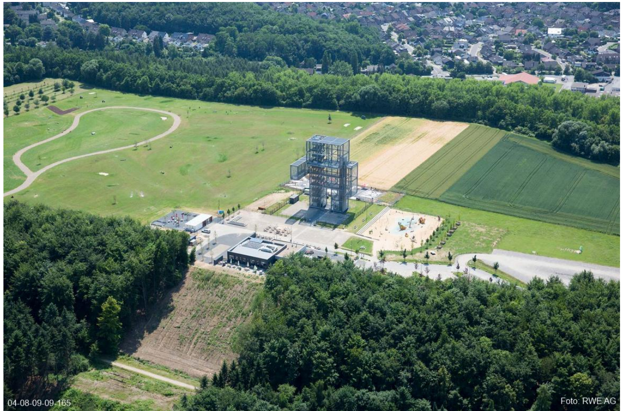
Goltsteinkuppe im Jahr 2023

In den Folgejahren wird die Goltsteinhalde immer intensiver als Naherholungsgebiet genutzt.